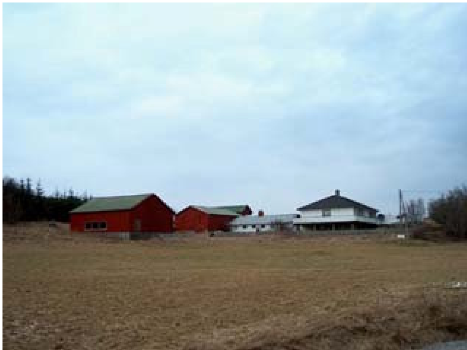
Skotsgrinnan, eller "Stene-gården" som gården også noen ganger blir kalt i dag. Villaen til høyre erstattet våningshuset i bildet på side 6.