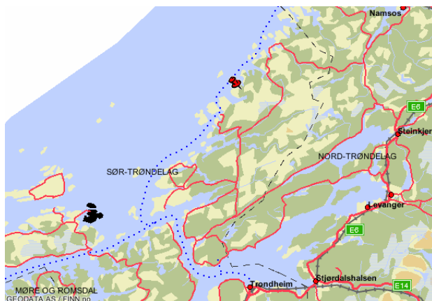
Kråkfjorden ligger sør for Roan kommunesenter, lengst nord på Fosenhalvøya (her avmerket med rødt). Fjellværøy er avmerket med svart nederst til venstre i bildet.