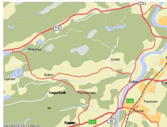
Fagerholt ligger like sør for krysset mellom riksvei 461 og 464 på vestsiden av Orkdalen. Eggen (Eggen) ligger ved E-39 der riksvei 461 møter europaveien.