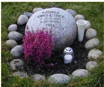
Gravstenen på kirkegården ved Nordbotn kirke

Brynhild hadde vært forlovet med et søskenbarn av Ragnar før de ble gift i 1947. Da hadde Ragnar vært til sjøs med handelsflåten i mange år.