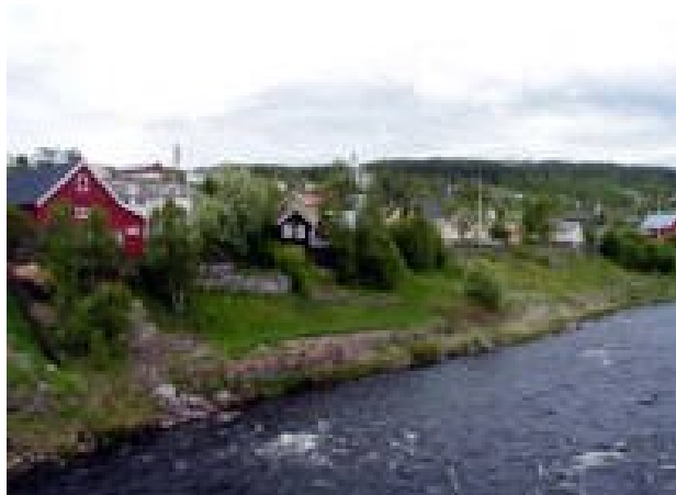
Tolga og gammelgata sett fra andre siden av Glomma.

Smeltehytta på Tolga ga grunnlaget for etablering av dagens sentrum i Tolga. Hytta lå der Malmplassen Gjestegård står i dag. Fortsatt ligger Gammelgata i Tolga sentrum som et minne om smeltehyttemiljøet. I følge Tolga kommune sine hjemmesider var smeltehytta "i drift fra 1666 til 1871. I denne 200-årsperioden betydde virksomheten ved smeltehytta svært mye for bygdelagene i Tolga kommune.