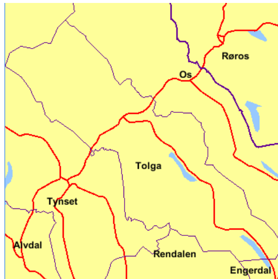
Tolga kommune. De røde linjene er veier, de lilla kommunegrensene.