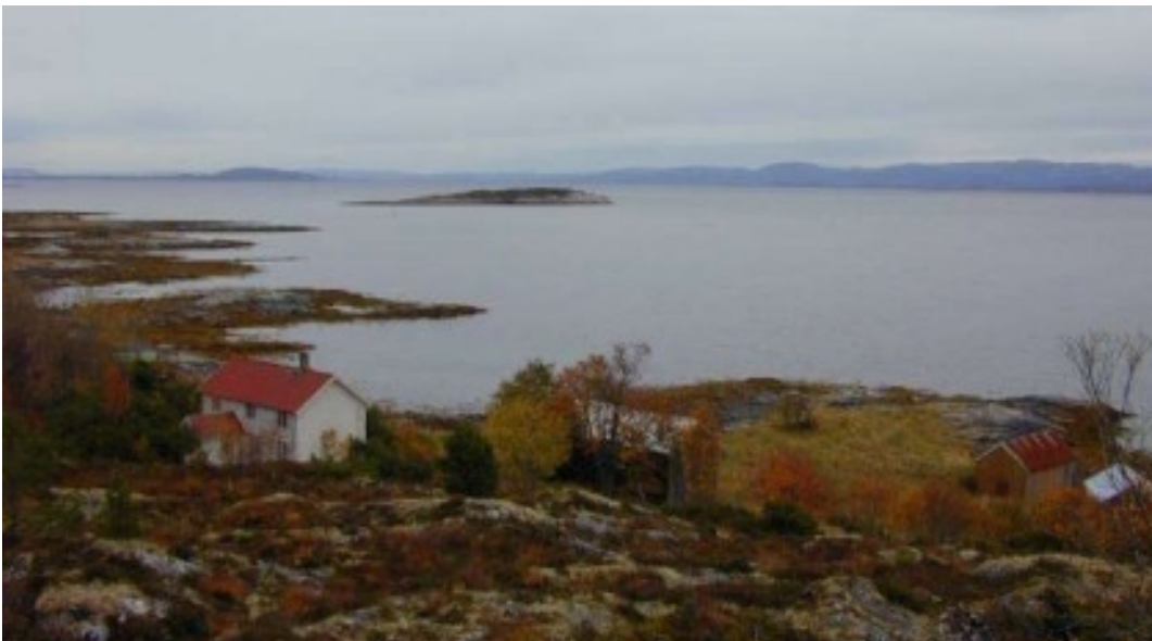
Stranden, eller Sørstranda som gården heter på kartet. Gården ligger sør på Fjellværøya og kan nås fra sjøen eller ved å følge stien ned fra Sørsæter. Det var ikke mye jord å dyrke her nede, og matrikkelen fra 1950 verdsetter da også gården til 0 mark og 22 øre. Bildet er tatt mot sørøst.

Gården fungerer i dag som sommersted til en familie fra Trondheim.